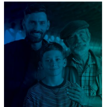
CUANDO SUS HIJOS YA SON MAYORES