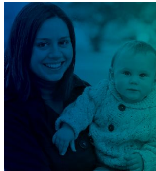
DESPUÉS DE DAR A LUZ